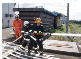
広域事務組合消防本部 様

9月1日〜4日の4日間、2年次のインターンシップを実施いたしました。例年、インターンシップ協力会の企業・団体の皆様から多大なご協力を頂いておりますが、特に、今年度は、新型コロナウイルスへの対応のため、例年以上に多くのご配慮を頂き、実施することができました。2年次生14名にとりて、貴重な体験となりました。ありがとうございます。写真でご紹介いたしました企業・団体様のほか、「金山コネクタ」・「金山ケミテック」・「星川建設」・「自衛隊新庄地域事務所」・「ファミリーハウスリーベ金山店」・「なかよし保育園」・「金山郵便局」・「グリーンバレー神室管理センター」(敬称略・順不同)様にインターンシップを受入れていただきました。ありがとうございます。11月に行われるインターンシップ協力会総会において、学習の成果を発表させていただきます。