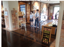
シェーンネスハイム金山 様