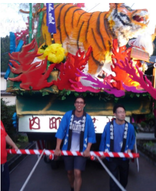
【金山まつり参加】(内町若蓮)

私は人生の次の冒険に出る時、最後に上台坂を上げて、車の窓から大好きな金山三峰と田んぼを見て、皆と作った思い出を笑顔で振り返る。いつ帰ってくるかわからないが、車から私の第二の故郷に一言を大声で叫ぶ。行ってきます！